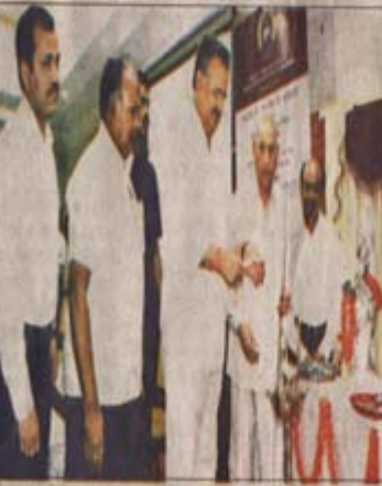
कोशट विकास योजना का मुख्यमंत्री ने किया शुभारंभ

मुख्यमंत्री डॉ. रमन सिंह ने बस्तर में रोजगार को बढ़ा देने में अग्रणी भूमिका निभाने के लिए स्टेट स्किल डेवलपमेंट मिशन (एसडीएम) की वेबसाइट का शुभारंभ किया। उन्होंने कहा कि वेबसाइट को शुरू करने के बाद वेबसाइट को 2022 के अंत तक अपडेट करने का काम करवा दिया जाएगा।